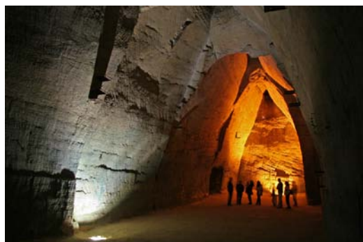
La grande salle