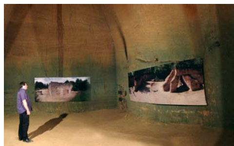
Exposition photos grands formats