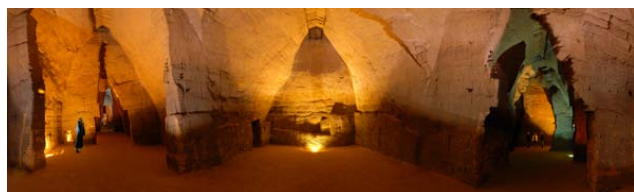
La seconde perspective