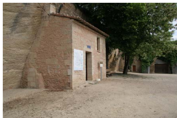
Accueil et boutique

La durée d'une visite libre est d'environ 45 min. Pour une visite guidée (possible toute l'année pour les groupes sur réservation) il faut compter environ 1h15.