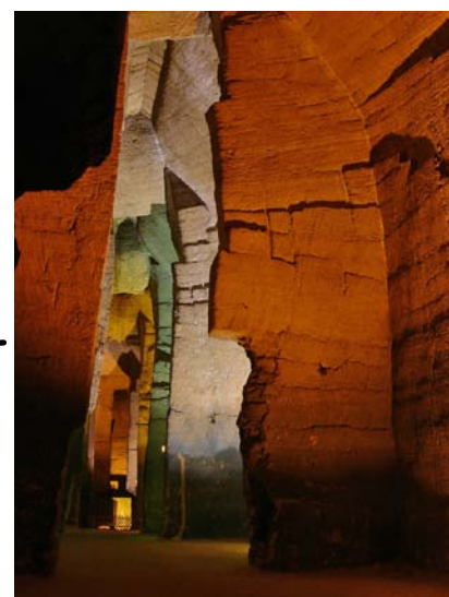
La première perspective